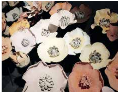
Das sind die Blüten aus Keramik, die die Inhaberin von Pentik kreierte.