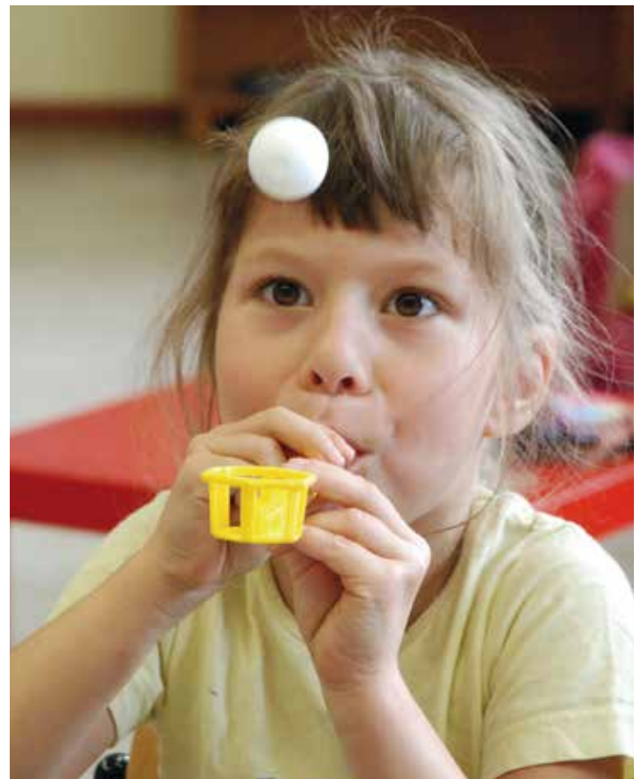
Der Atemtrainer ist Bestandteil von Klasse2000.

Wenn auch Ihr Club sich mit Klasse2000 für die Gesundheit von Kindern vor Ort engagieren möchte, können Sie über info@klasse2000.de kostenlos die Broschüre „Lions – starke Partner für Kindergesundheit“ bestellen, in der es um langfristige Förderstrategien geht. Weitere Informationen unter: www.klasse2000.de