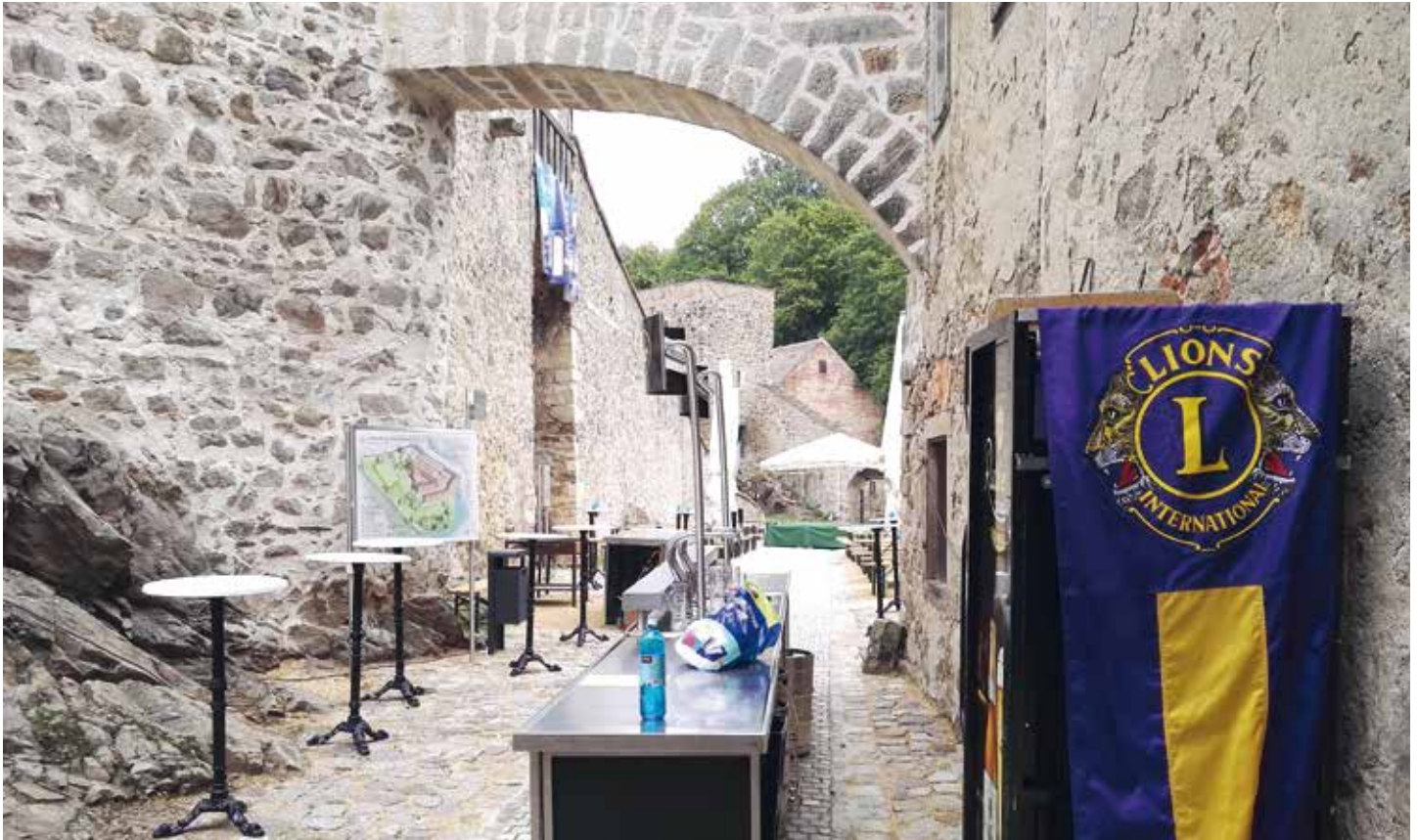
Die 6. Radeberger Schlossnacht fand im Schloss Klippstein statt.