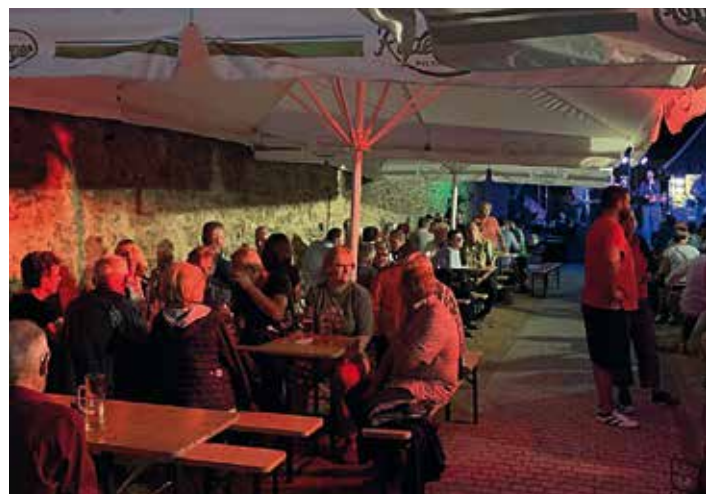
Zahlreiche Radeberger und Gäste der Stadt besuchten die Veranstaltung.

Am 16. November 2019 lädt der Lions Club zur Radeberger Ballnacht in den Kaiserhof ein. Ebenfalls eine öffentliche Veranstaltung, zu der wir immer auch gern Lionsfreunde anderer Clubs begrüßen. Der Erlös der Tombola kommt dem Projekt „Helfer auf vier Beinen“ des sächsischen Epilepsiezentrums Kleinwachau zugute.