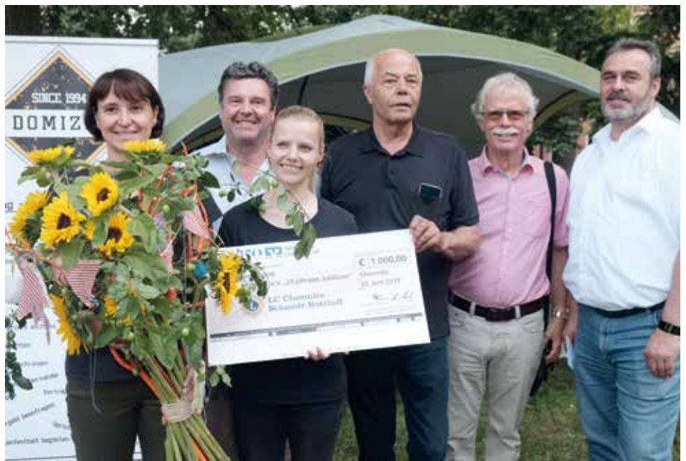
Auf dem Nachbarschaftsfest überreichten Lionsfreunde des LC Chemnitz Schmidt-Rottluff dem Domizil e.V. eine Spende.

Bereits seit 1992 bieten die Streetworker auf der Basis von Vertraulichkeit und Freiwilligkeit jungen Menschen Beratung, Hilfe und Begleitung an. Der Beratungsansatz Mobile Jugendarbeit umfasst Streetwork, Einzelfallhil-