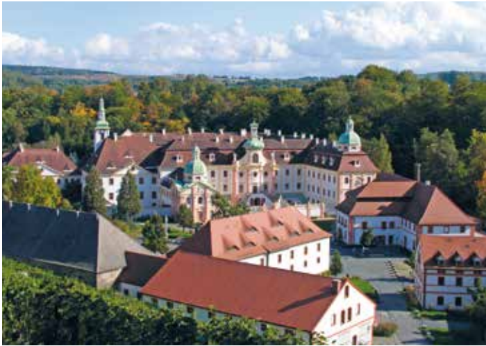
Hier im Kloster St. Marienthal fand die Distriktversammlung statt.