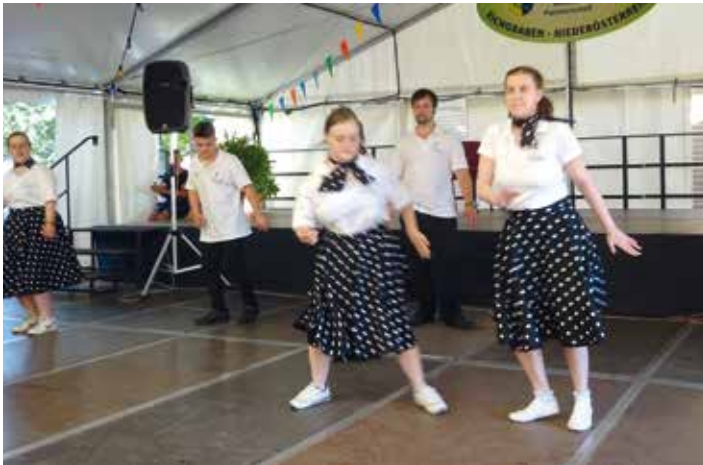
Die Leo-Tanzgruppe aus Eichgraben in Aktion.

rend einer Aufführung im Festzelt übergab der Lions Club Zittau eine Spende von 400 Euro zur Finanzierung dieser Reise. Die Zuschauer im Festzelt spendeten der Tanzgruppe begeisterten Beifall und würdigten gleichzeitig das Engagement der Lions aus Zittau.