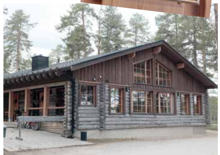
Hier befindet sich das Clublokal vom LC Posio in Lappland.