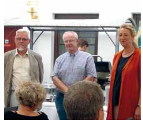
In Freiberg trafen sich Mitglieder der drei Service-Clubs.