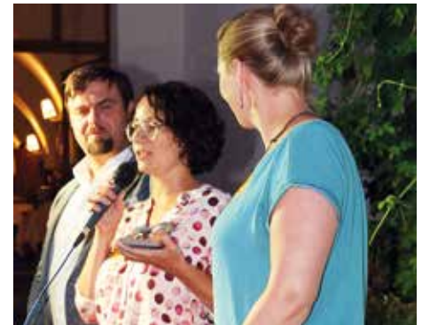
Den Görlitzer Löwenpreis 2019 erbielt „Tierra – Eine Welt e.V.“.