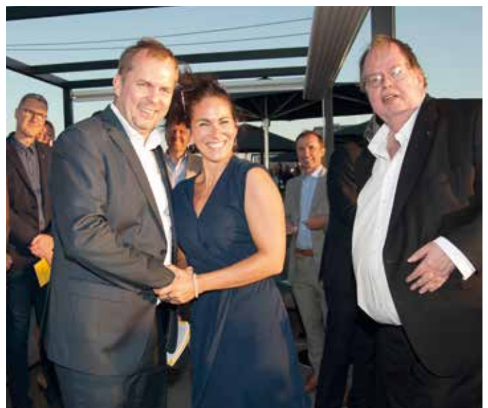
Übergabe der Urkunden an die Lionsfreunde.