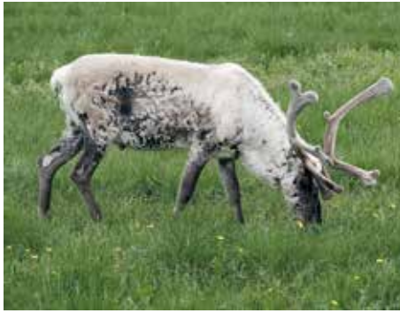
Bei unseren Unternehmungen hatten wir fast täglich Begegnungen mit Rentieren.