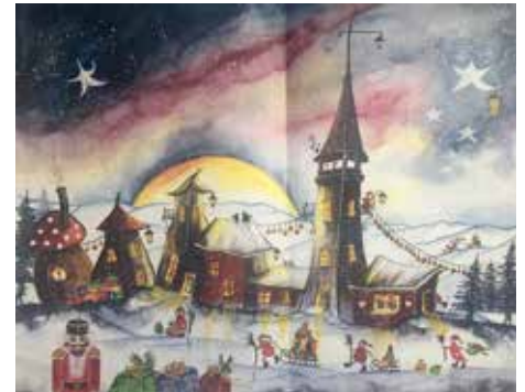
Das Motiv des Kunst- und Adventskalenders.

Wir denken, das ist eine sehr schöne Geschenkidee zum Jahresende. Der Empfänger bekommt einen attraktiven Kalender geschenkt, nimmt an einer Verlosung mit ansprechenden Preisen teil und kann etwas Gutes durch seine freiwillige Geldspende bewegen.