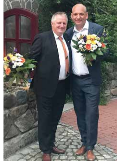
Präsidentschaftsübergabe beim LC Bautzen.

Vorstand sowie an alle Clubmitglieder. Einig war man sich darin, dass die Planung gemeinsamer Projekte zum Wohle der Bautzener Region auch im folgenden Amtsjahr oberste Priorität haben wird - dies getreu dem Motto „We serve - wir dienen“.