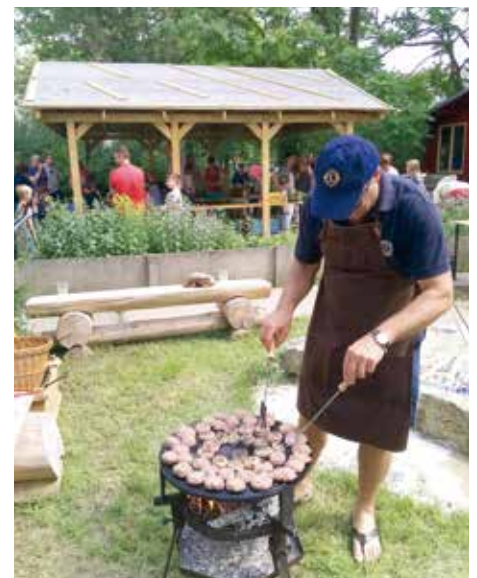
Lionsfreunde beim Einsatz zum Koch-Event.

Unsere Devise ist auch weiterhin "Gemeinsam sind wir stark".