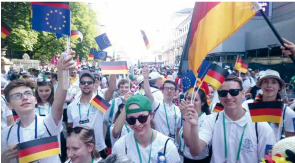
Impressionen von der Internationalen Parade.