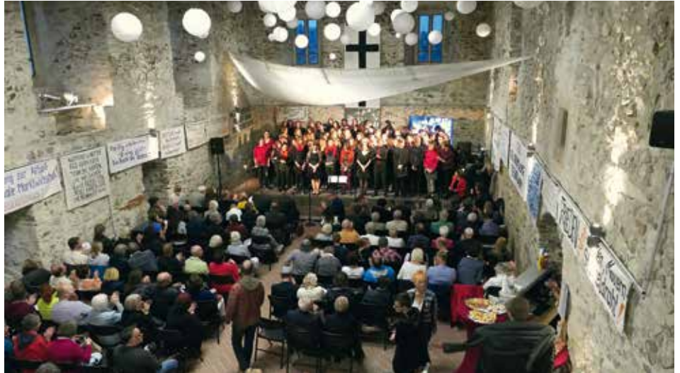
Blick in den Komturhof zur Veranstaltung des Lions Clubs Plauen Spitze. Links und rechts an den Wänden Originalplakate der Plauener Samstagsdemonstrationen. Auf der Bühne der Chor des Diesterweg-Gymnasiums Plauen.