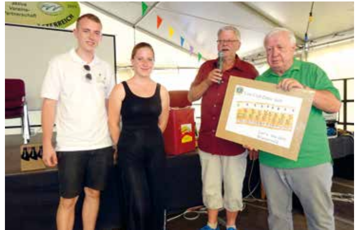
Übergabe einer Spende durch die Zittauer Lions für die Tanzgruppe der Leos.