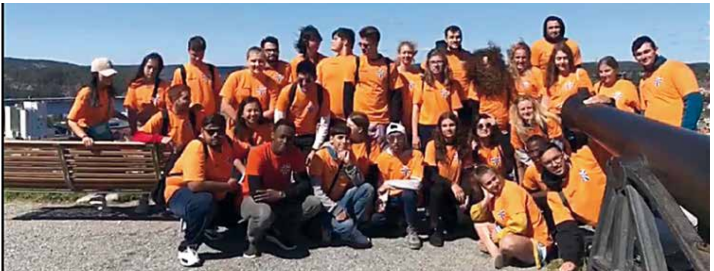
Das Lions Jugend-Camp in Norwegen.

Ein großes Dankeschön an die norwegischen und deutschen Lions, die uns diese Erfahrungen und besonderen Erlebnisse mit ihrem tollen Einsatz ermöglicht haben.