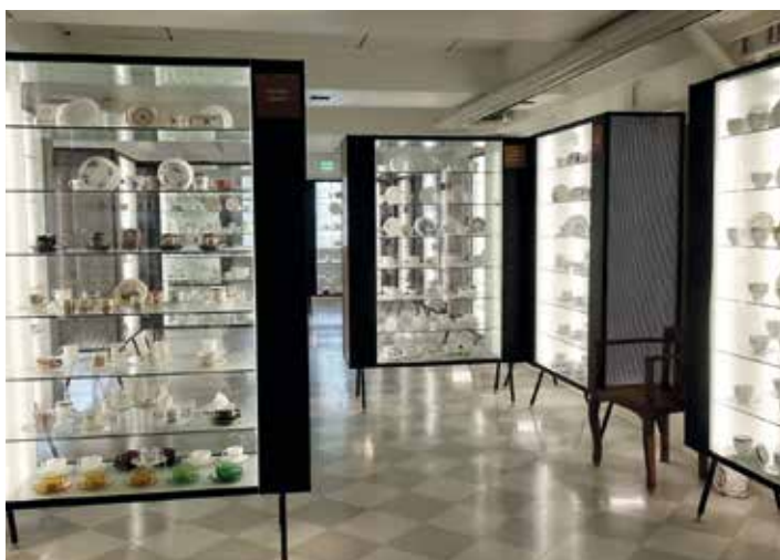
Im Areal von Pentik ist ein internationales Tassenmuseum zu besichtigen.