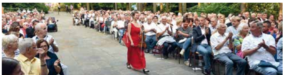
Impressionen vom Galakonzert auf der Waldbühne.