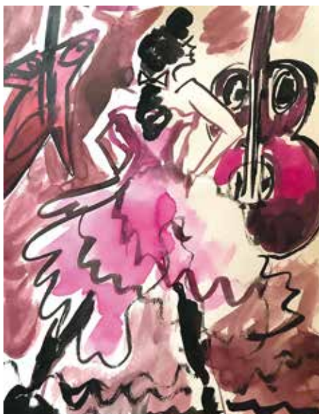
„Funky Bellas“ von Charlott Weise.