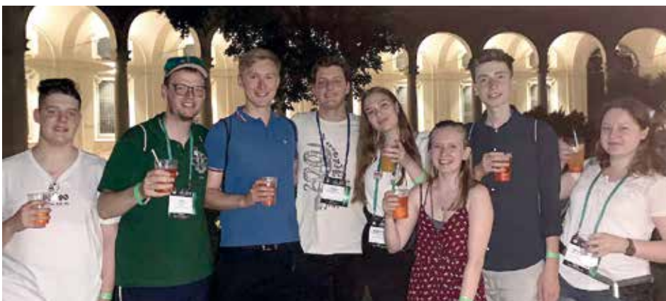
Sächsische Leos in Mailand.