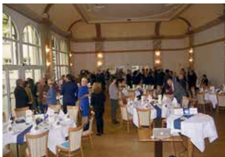
Im Braubhof Freiberg fand die Jubiläumsfeier statt.

Insgesamt hat der Club fast 300.000 Euro an Spendengeldern in seiner 25-jährigen Geschichte an Bedürftige, kulturelle und soziale Projekte weitergereicht. Jährliche Höhepunkte sind mittlerweile die Beteiligung am Bergstadtfest in Freiberg mit einem Sektstand, der Glühweinstand auf dem Freiburger Christmarkt und der bereits in 5. Auflage erschienene Lions Adventskalender.