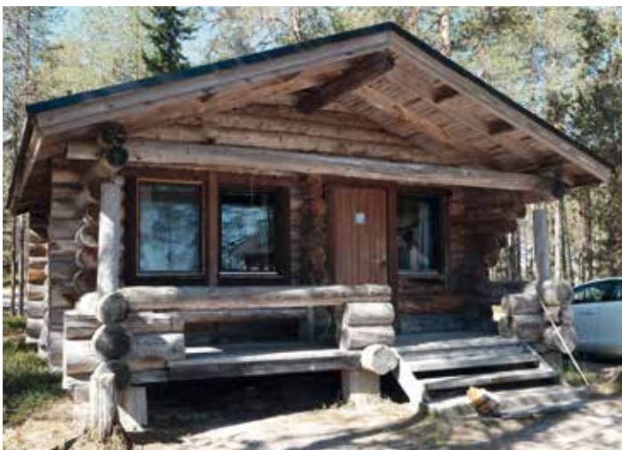
Diese Hütten am See haben uns beeindruckt und sind eine perfekte Urlaubsunterkunft.