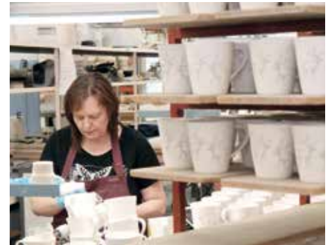
Pentik produziert auch Keramik mit Rentiermotiven.

schaft von fast 300 Mitarbeitern wird 2020 das 50-jährige Betriebsjubiläum gefeiert. Pentik stellt eine große Vielfalt an Gebrauchs- und Studiokeramik her, die über ein hochmodernes Logistiklager und 27 Filialen und sowohl einigen eigenen auf Franchise-Basis geführten Geschäften in Finnland und Skandinavien vertrieben wird. Über das Internet wird inzwischen die internationale Nachfrage bedient. Während des Betriebsrundgangs konnten wir auch Maschinen und Anlagen aus Sachsen und Thüringen kennenlernen.