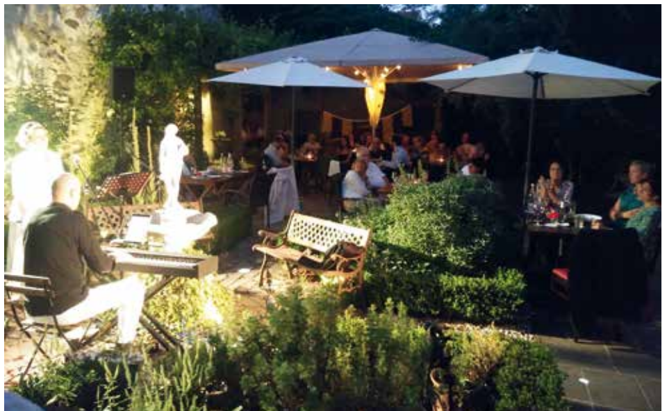
Blick in den malerischen Hof des Cafés.