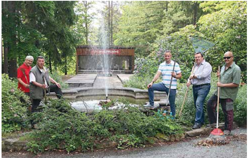
Lionsfreunde bei der Vorbereitung des Konzertes.

Mittlerweile ist es uns gelungen, die regionale Presse als aktive Partner zu gewinnen. Nach vorherigen Gesprächen begleiten sie unsere Vorhaben sehr wohlwollend und helfen uns