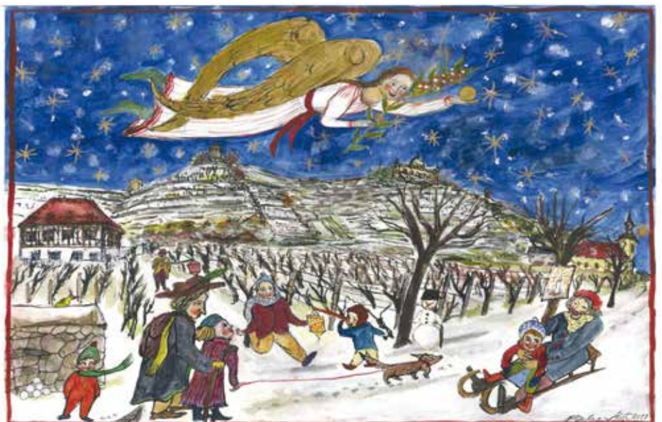
Der limitierte Kalender ist seit dem 1. Oktober im Verkauf.

Kalender. Alle weiteren Informationen zur Adventskalenderaktion 2019 findet man auf der Internetseite www.lions-radebeul.de mit dem Hinweis auf den Vorverkauf.