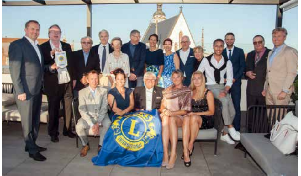
Der neue Lions Club Leipzig.