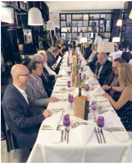
Charterfeier im Hotel „Innside by Meliá“.