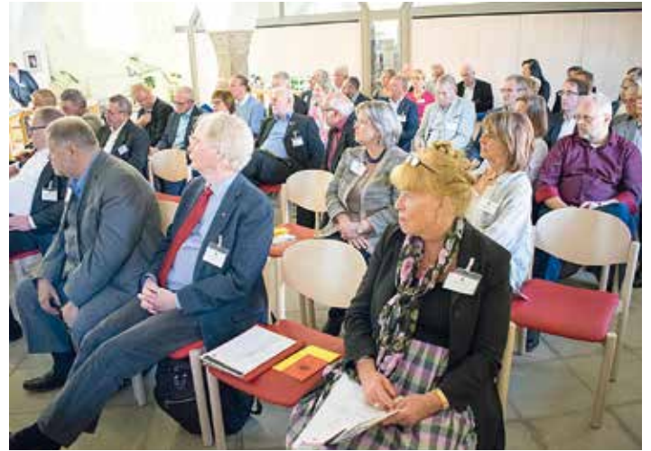
Blick in den Saal.