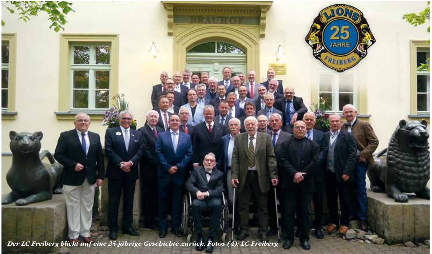
Der LC Freiberg blickt auf eine 25-jährige Geschichte zurück.

Insgesamt 300.000 Euro an Spendengeldern übergeben