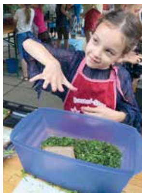
Die Kinder bei der Verarbeitung der Früchte ihrer Schulgartenarbeit.

schuljahres jährlich mit zwei Klassen auf dem Land- und Forstwirtschaftshof eines unserer Clubmitglieder „Unterricht auf dem Lande“ praktizieren und dabei Natur pur erleben und genießen.