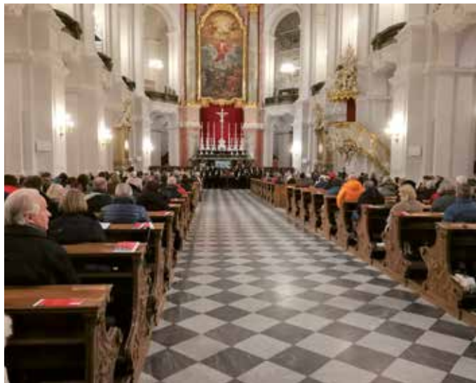
Oben: Blick in die voll besetzte Kathedrale