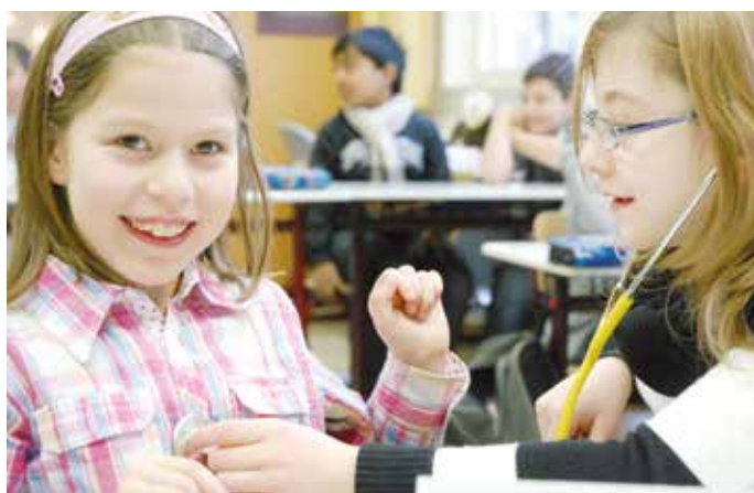
Kinder bei der Beschäftigung mit dem Stethoskop

Eine neue Studie des Kriminologischen Forschungsinstituts Niedersachsen (KfN) belegt, dass der Alkohol-, Zigaretten- und Cannabiskonsum