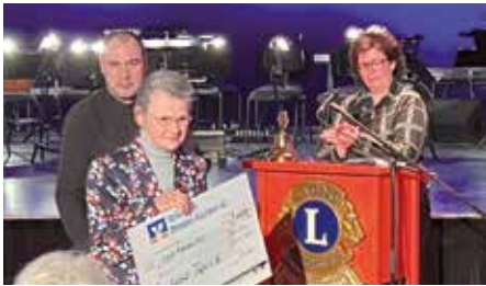
Die Bautzener Tafel freute sich über eine Spende in Höhe von 2.000 Euro.