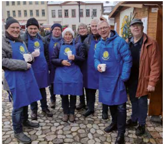
Die Glauchauer Löwen auf dem Weihnachtsmarkt.

Der Erlös des Verkaufes geht auch in diesem Jahr wieder an soziale Projekte in der Region.