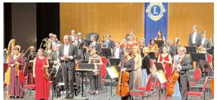
Die Musiker der Mittelsächsischen Philharmonie Freiberg