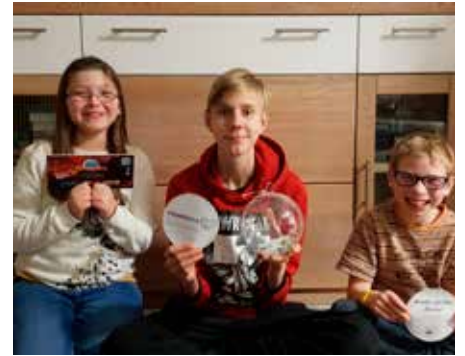
Kinder der Wohngruppe Blume freuen sich auf den Besuch im Schneeberger „Fundora“.