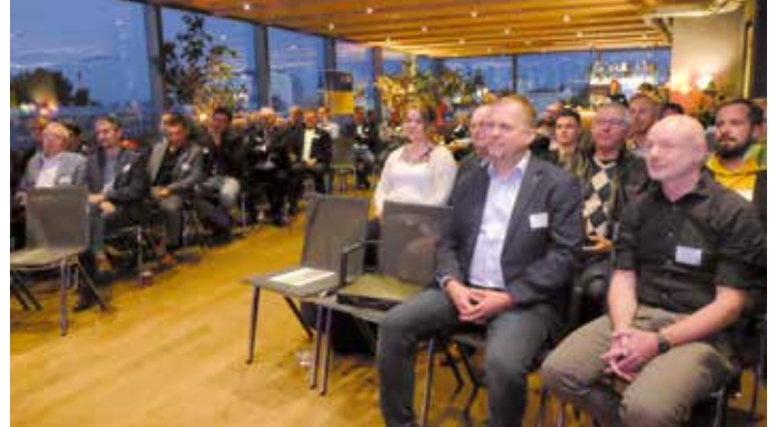
Blick in den Veranstaltungsraum.