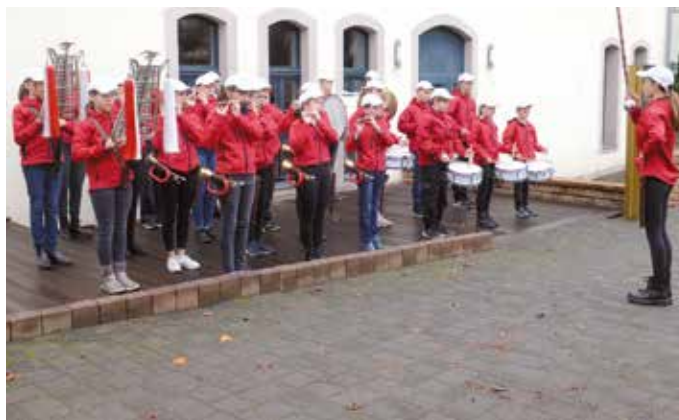
Der Spielmannszug der Stadt Radeberg begrüßte die Teilnehmer.