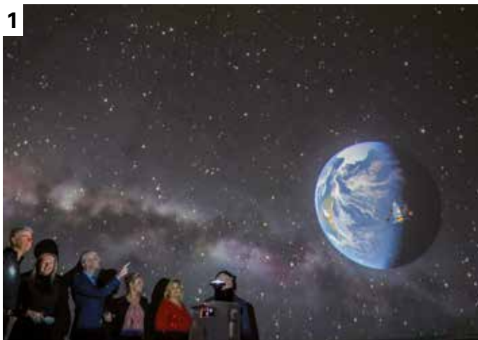
1.+ 2. Im mobilen Planetarium wurde u.a. der Sternenhimmel mit Erde gezeigt. 3. Das mobile Planetarium in der Turnhalle.