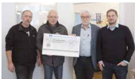
Übergabe des Spendenschecks an das Familienbüro.