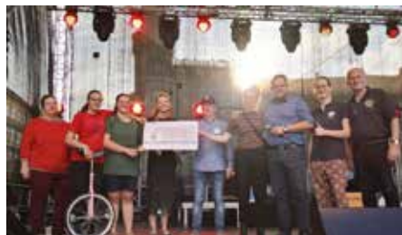
Scheckübergabe an Cyrkus.

Im Vorfeld hatten die Lions, LEOs und die Gewinner des Löwenpreises an zahlreichen Wochenenden am gemeinsamen Stand und in verschiedenen Vorverkaufsstellen 2190 Adoptionscheine verkauft und – mit allen Vor- und Nachbereitungen - 520 Teamstunden für diese Activity aufgewendet. Unter den Kunden war auch Ministerpräsident Michael Kretschmer.