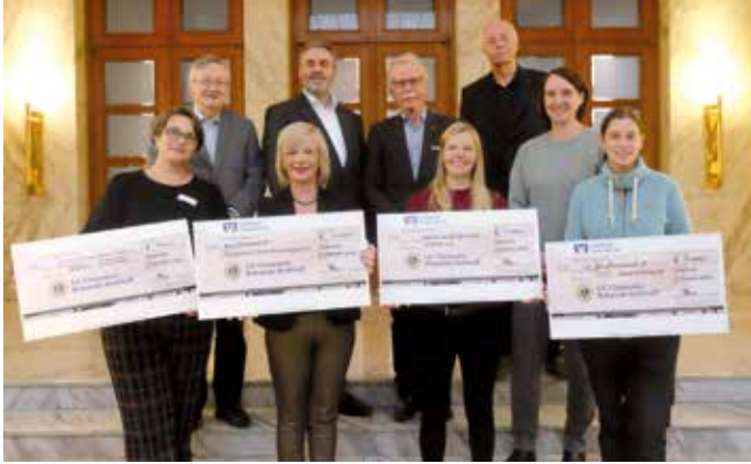
Lionsfreunde übergeben die Spendenschecks an die Vereine