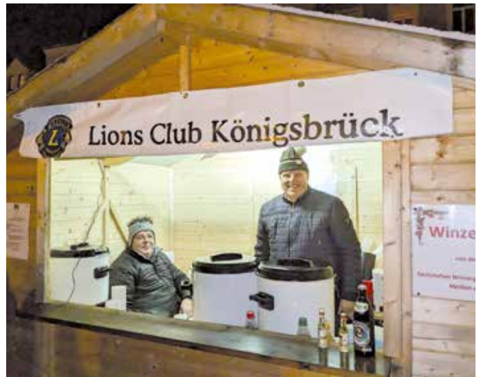
oben: Der Stand des Clubs auf dem Trödelmarkt in Königsbrück unten: Glühweinstand auf dem Christmarkt.