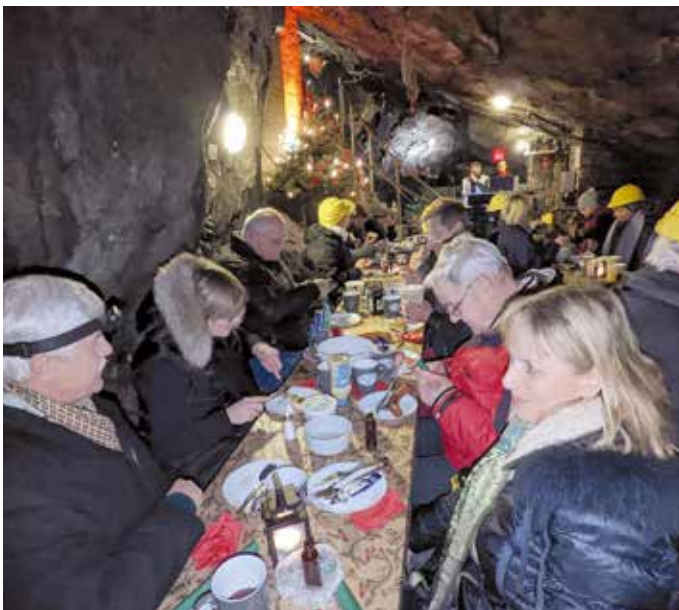
Mettenschicht im Besucherbergwerk „Marie Louise Stolln“.