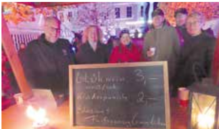
Spenden- und Glühweinstand des Lions Club Crimmitschau-Werdau im November 2022.