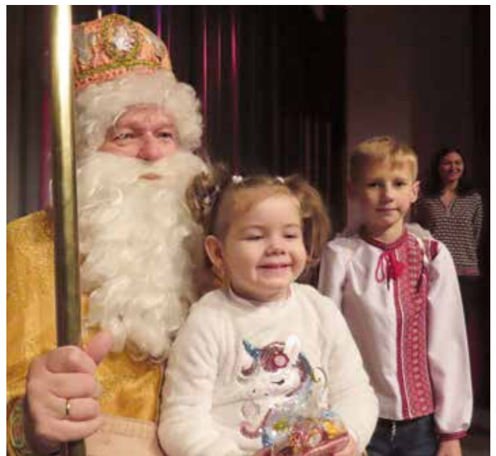
Migranten und Helfer bei einer bewegenden Adventsfeier.

Die Kinder wiederum konnten sich sowohl über ein Geschenk aus der ukrainischen Gemeinschaft als auch von den Helfern freuen. Möglich würde das dank der Unterstützung des Lions Club Crimmitschau - Werdau.