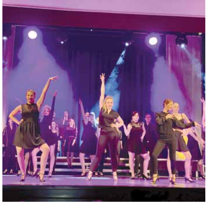
Das Ensemble Studio W.M aus Chemnitz beim Konzert. Ausschnitt aus einem Musical.