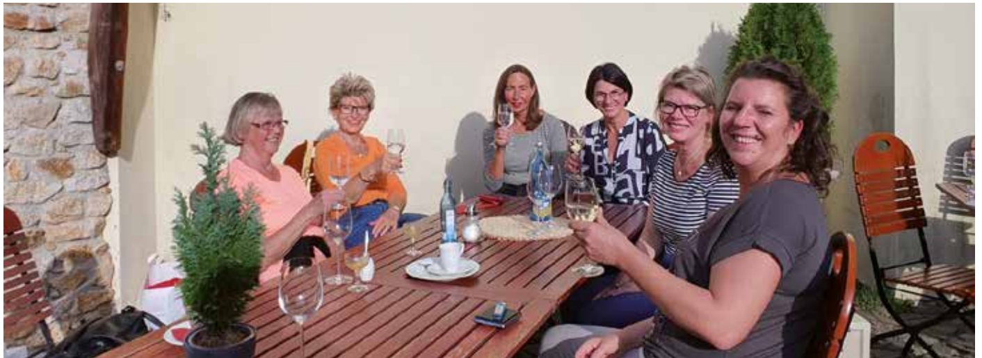
Teambuilding-Fahrt nach Görlitz im vergangenen Herbst.