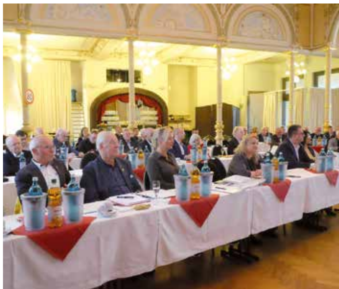
Historischer Tagungsaal im Hotel Kaiserhof.