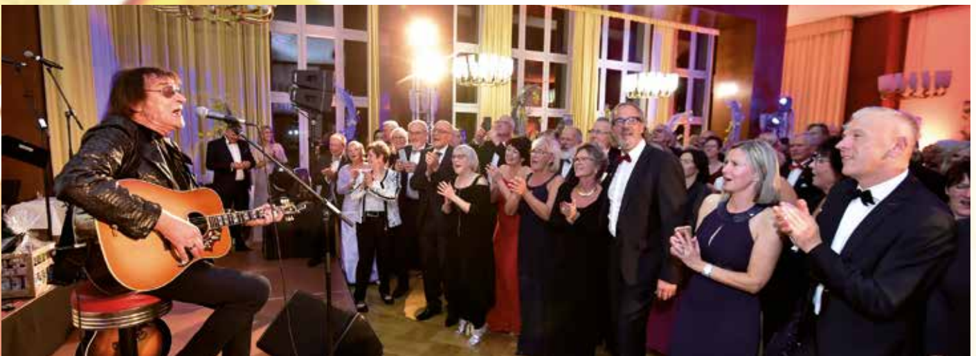
Der Frontmann der Puhdys sorgte für Fuore.