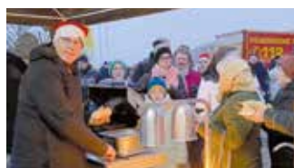
Bildimpressionen von der Auftaktveranstaltung der Hafenweihnacht des LC Leipzig-Tilia lipsiensis.