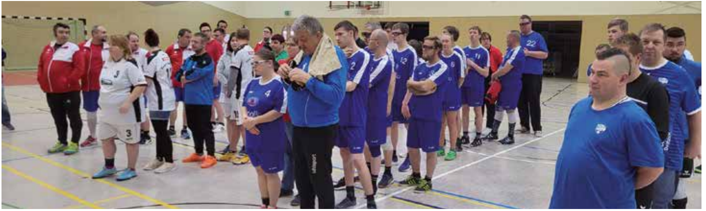
Die Mannschaften des Weihnachtsturniers.