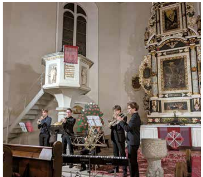
Adventsbefizkonzert in der Hauptkirche.