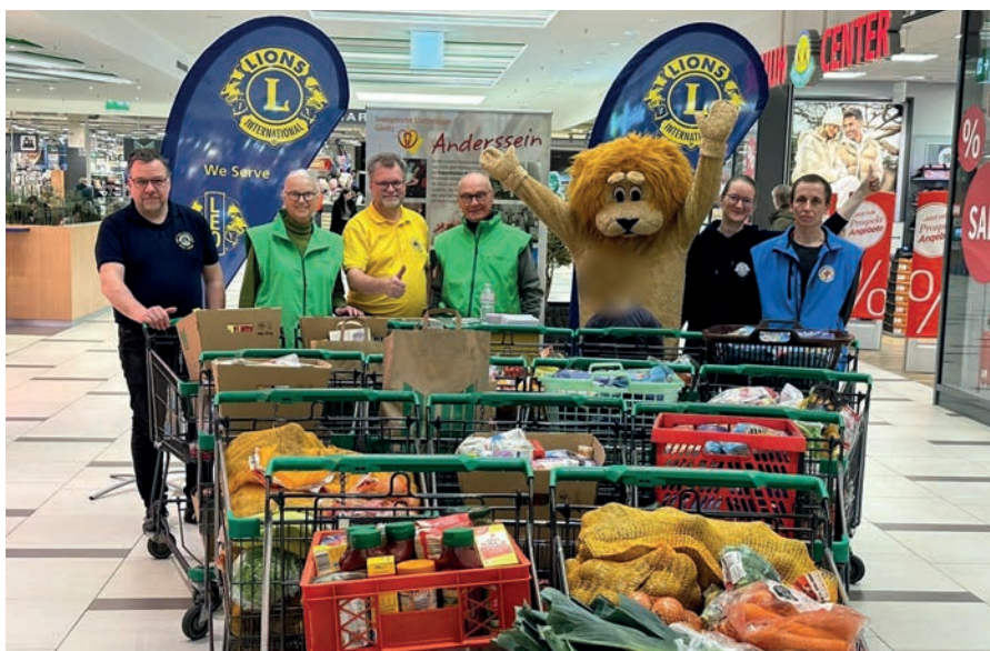
Die Wagen mit Spenden für die Stadtmission.

Stadt in den folgenden Tagen und Wochen einige schmackhafte warme Mahlzeiten erhielten.