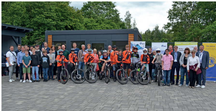
Alle Teilnehmer der TALENTSHOW konnten sich über einen Preis für ihr Projekt freuen.

Am 14. Juni veranstaltete die IMM Stiftung zum 20. Mal ihre TALENTSHOW und lobte im Jubiläumsjahr Preisgelder im Wert von rund 3.500 Euro aus. Auch der Lions-Club Mittweida/Burgstädt, als langjähriger Partner, unterstützte die Veranstaltung. In diesem Jahr präsentierten sich Talente aller Altersstufen mit insgesamt zwölf Projekten speziell in den Bereichen „Wissenschaft/Technik“ und „Projektinitiativen“ sowie in den Sonderkategorien „Energie.Umwelt.AWARD“ und „KREATIVITÄT“. Jedes Projekt durfte sich über einen Geldpreis zur Förderung junger und „reifer“ Talente freuen!