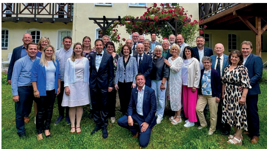
Die Mitglieder des Lions-Club Mittweida/Burgstädt feierten ihr 30-jähriges Jubiläum in der Villa Wilisch in Amtsberg.

Für das Engagement in unserem Club sage ich allen ganz herzlich Dank! (Auszug aus der Festrede)