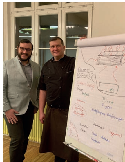
Auf dem Flipchart sind die Wunschgerichte der Kinder für die nächsten Termine der Kochschule vermerkt.

Da die Finanzierung der Kochschule nicht direkt über die Einrichtung erfolgen kann, war das „Geburtstagsgeld“ der Lions hier gut angelegt, denn die Kinder nehmen hier etwas mit, was ihnen in ihrem späteren Leben hilft.