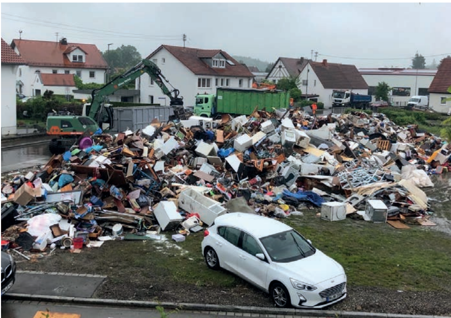
Einer der 3 Müllberge, die über den Verlauf einer Woche abgebaut, aber auch immer wieder beliefert wurden.